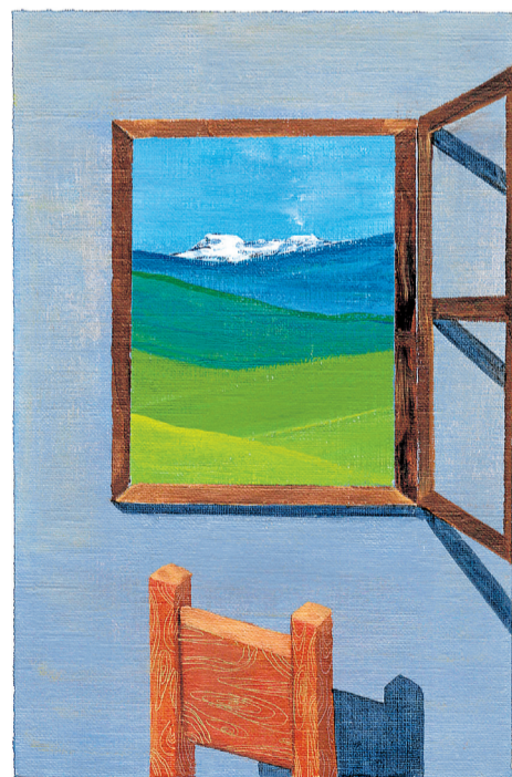
Nevado del Ruiz.

Significa contar una historia, mi historia, pero a través de imágenes altamente universales con las cuales quiero que cualquier persona se pueda identificar. Es algo