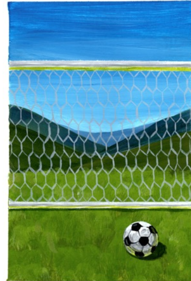
Balon , 2017; oil and acrylic on canvas, 12 x 9 in. [30.5 x 22.9 cms]

(December 12, 2017) Gitler & _____ is pleased to announce the forthcoming solo exhibition from Colombian-born artist Esteban Ocampo-Giraldo, entitled Fragmenticos . This series of new, small-scale paintings depict the artist's fragmented memories of seemingly small moments from his youth – none of them specific to a particular place and time, but rather, portraits and landscapes of the flotsam of one's mind. These small oil-and-acrylic paintings – the first time Ocampo-Giraldo has made such works the focus of an exhibit – are characterized by textural brushstrokes, hard shadows, and what he refers to as “a very specific sunlight.”